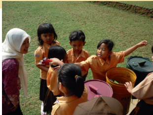
"Pengenalan Jenis Sampah"